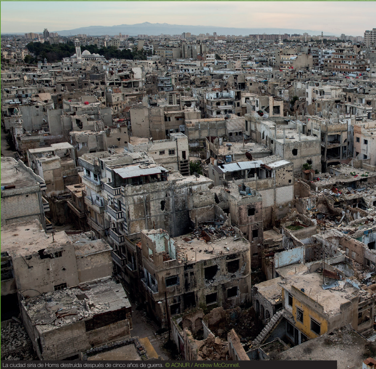
La ciudad siria de Homs destruida después de cinco años de guerra.