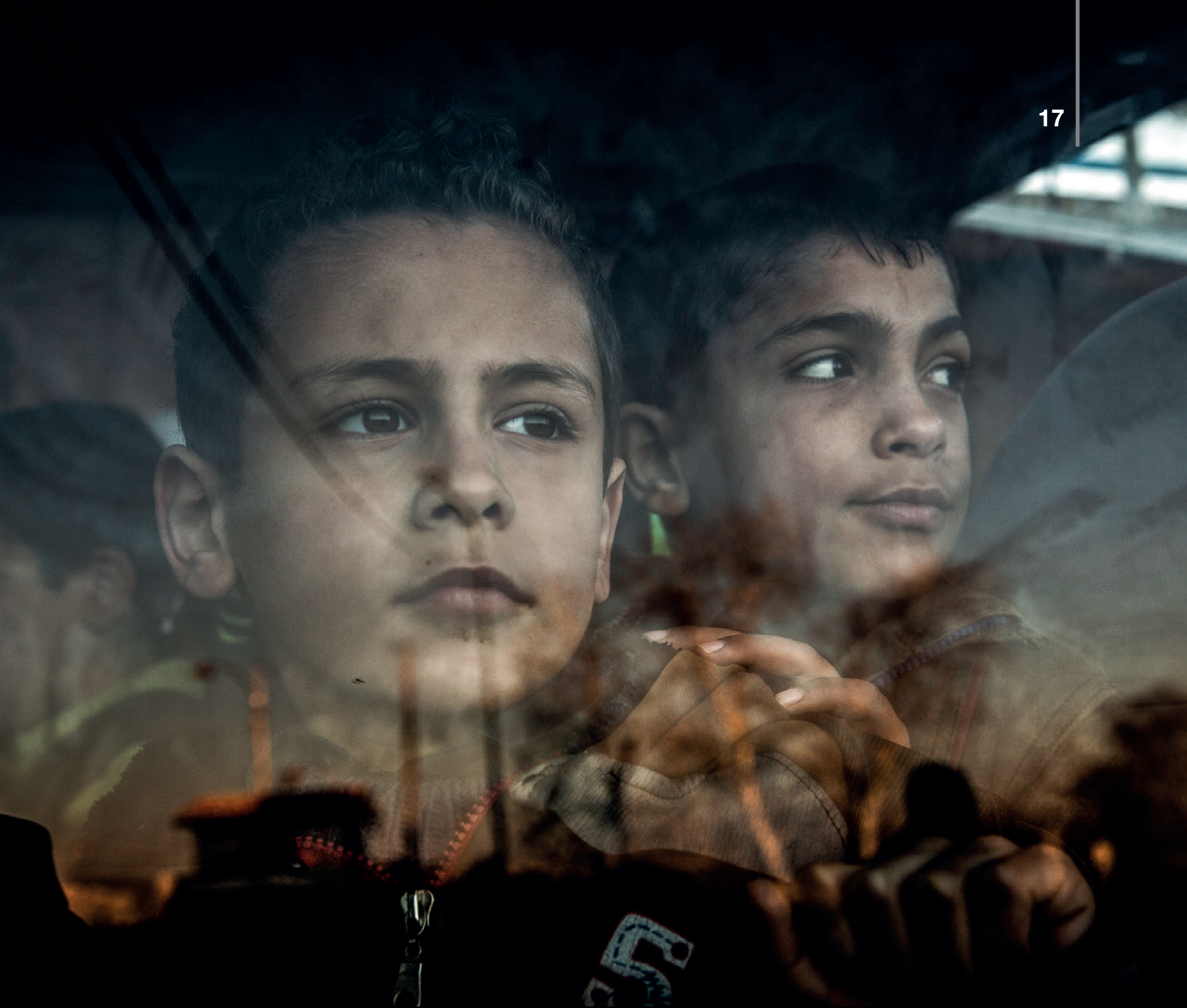
Niños en un orfanato de Homs (Siria).