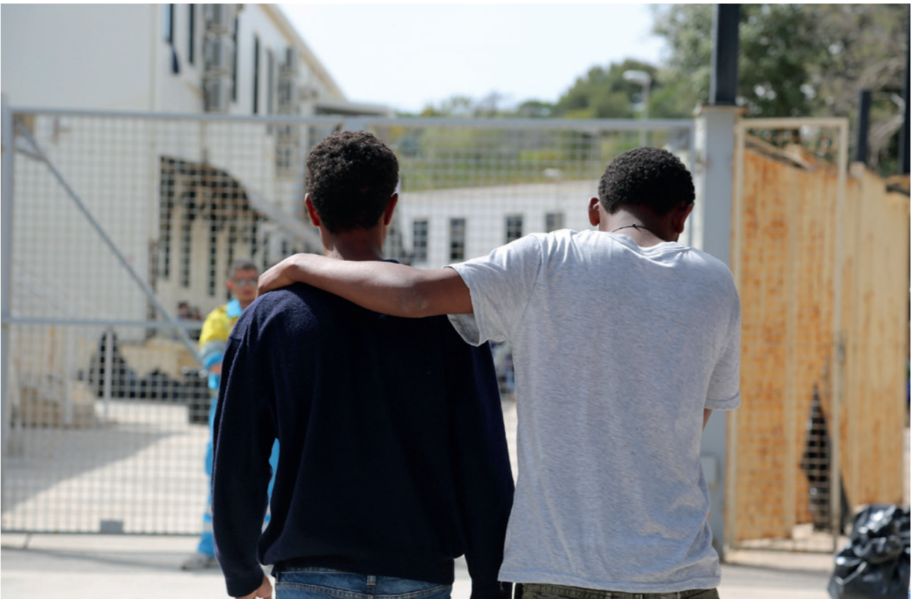
Dos refugiados africanos internados en el centro de Lampedusa (Italia).

La Unión Europea necesita un verdadero y eficaz Sistema Europeo Común de Asilo, inspirado en los que reconoce como sus principios fundacionales. Un año más se identificaron notables diferencias entre los porcentajes de concesión de protección interna-