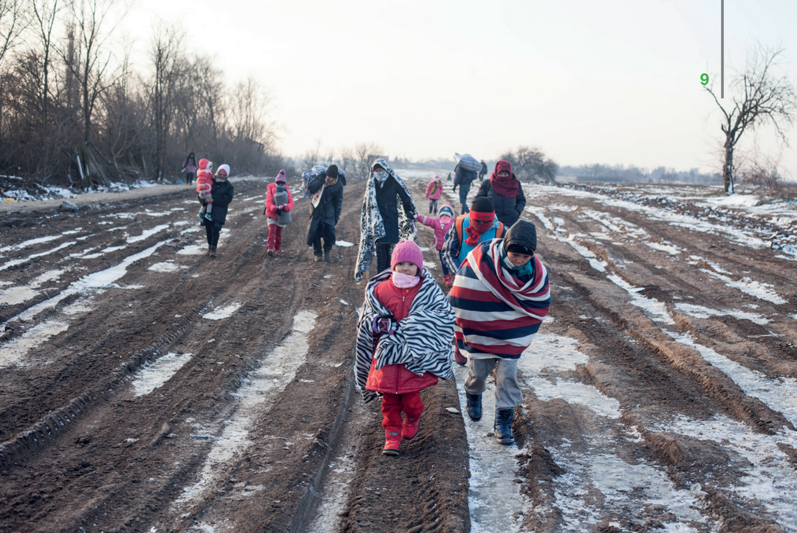
Personas refugiadas atravesando la frontera de Macedonia con Serbia en enero de 2016.

cional, así como en las condiciones de acogida. Esta realidad hace más lejana la consecución de un Sistema Europeo Común de Asilo.