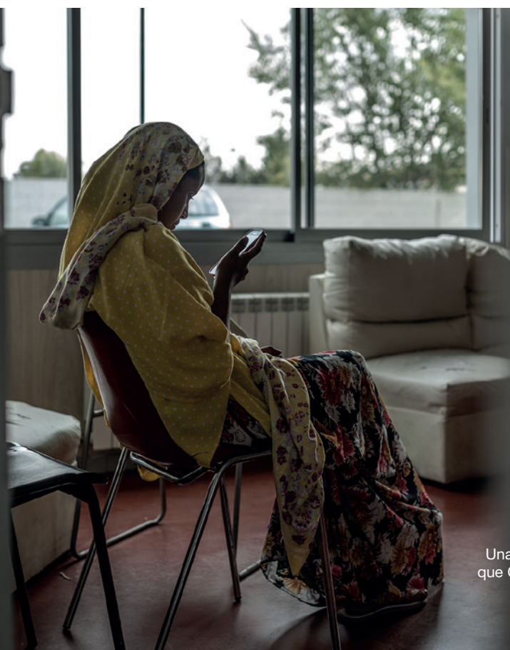
Una refugiada en el centro de acogida que CEAR gestiona en Getafe (Madrid).

Por último, a lo largo de 2015 solo cuatro personas que llegaron como polizones en buques que atracaron en puertos españoles pudieron solicitar protección internacional. En cuanto a los CIE, aunque CEAR no ha podido conocer el número total de solicitudes presentadas en estos centros el pasado año, quedó claro que, en función del centro en que la persona necesitada de protección internacional estuviera internada, el acceso al procedimiento variaba de manera notoria. Ello dependió de las entidades y organismos que pudieron ingresar en estos centros para brindar información y de si estos disponían de un servicio de orientación jurídica, que solo existe en los de Madrid, Barcelona y Valencia. En estos casos hay mayores posibilidades de acceso a la información y esto se traduce en el aumento del número de solicitudes de los últimos años •