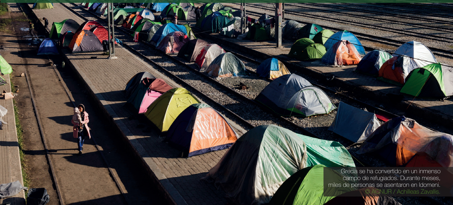
Grecia se ha convertido en un inmenso campo de refugiados. Durante meses, miles de personas se asentaron en Idomeni.

5. La trasposición inmediata de las directivas europeas en materia de asilo y la aprobación urgente del Reglamento que desarrolle normativamente la Ley de Asilo, pendiente desde hace casi siete años.