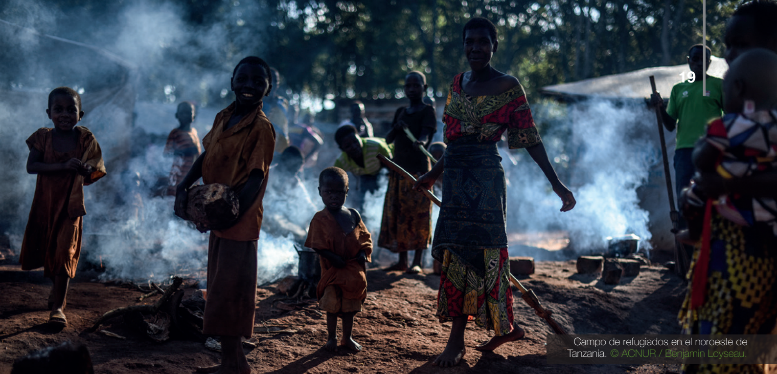
Campo de refugiados en el noroeste de Tanzania.